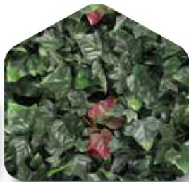
ENREDADERA DE VERANO